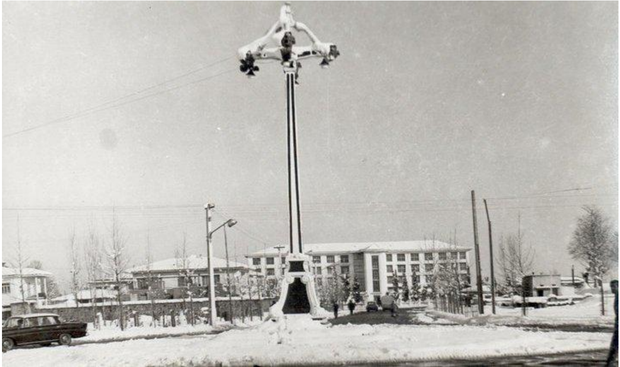
کاشف السلطنه لاهیجان