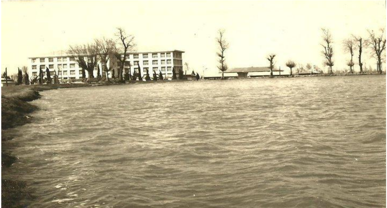
استخر و شیطان کوه لاهیجان