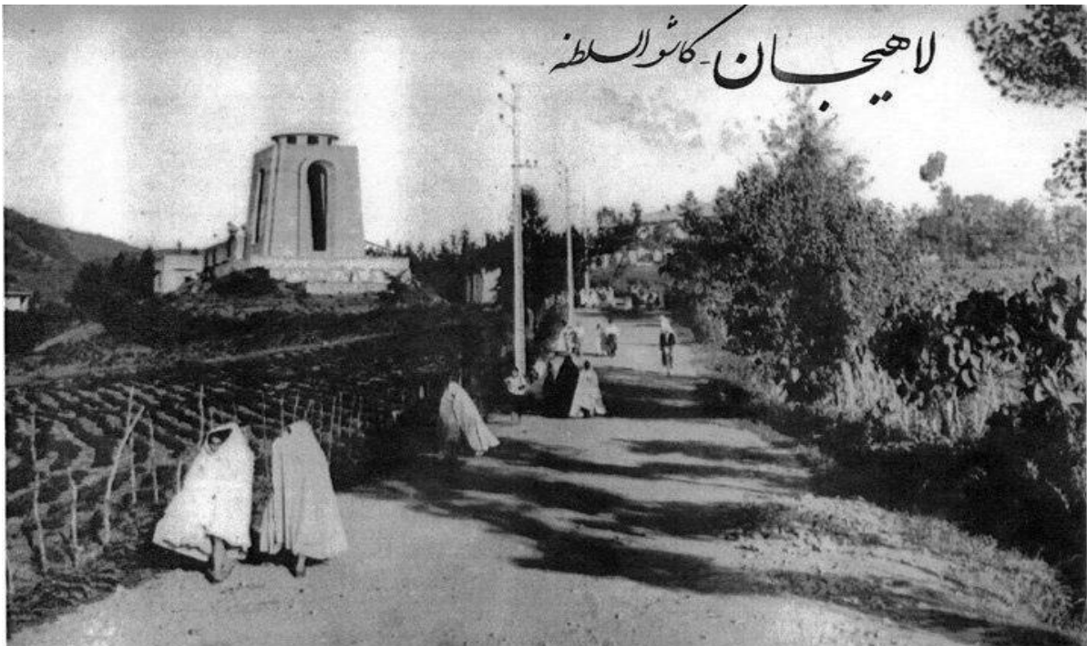
لاهیجان - کاشف السلطنه